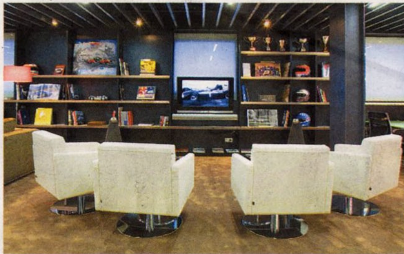
ZONA EXCLUSIVA. En la sede hay zonas de reunión para los asociados.

Ferrari F430 Spider, un Lamborghini LP560-4, dos Aston Martin (DB9 Volante y un V8 Vantage), dos Bentley (Continental GTC y Flying Spur), un Audi R8, dos Maserati (un Gran Turismo y un Quattroporte Sport) y un Porsche 911 4S Cabrio. Esta año llegarán un Ferrari California y un Porsche Panamera.